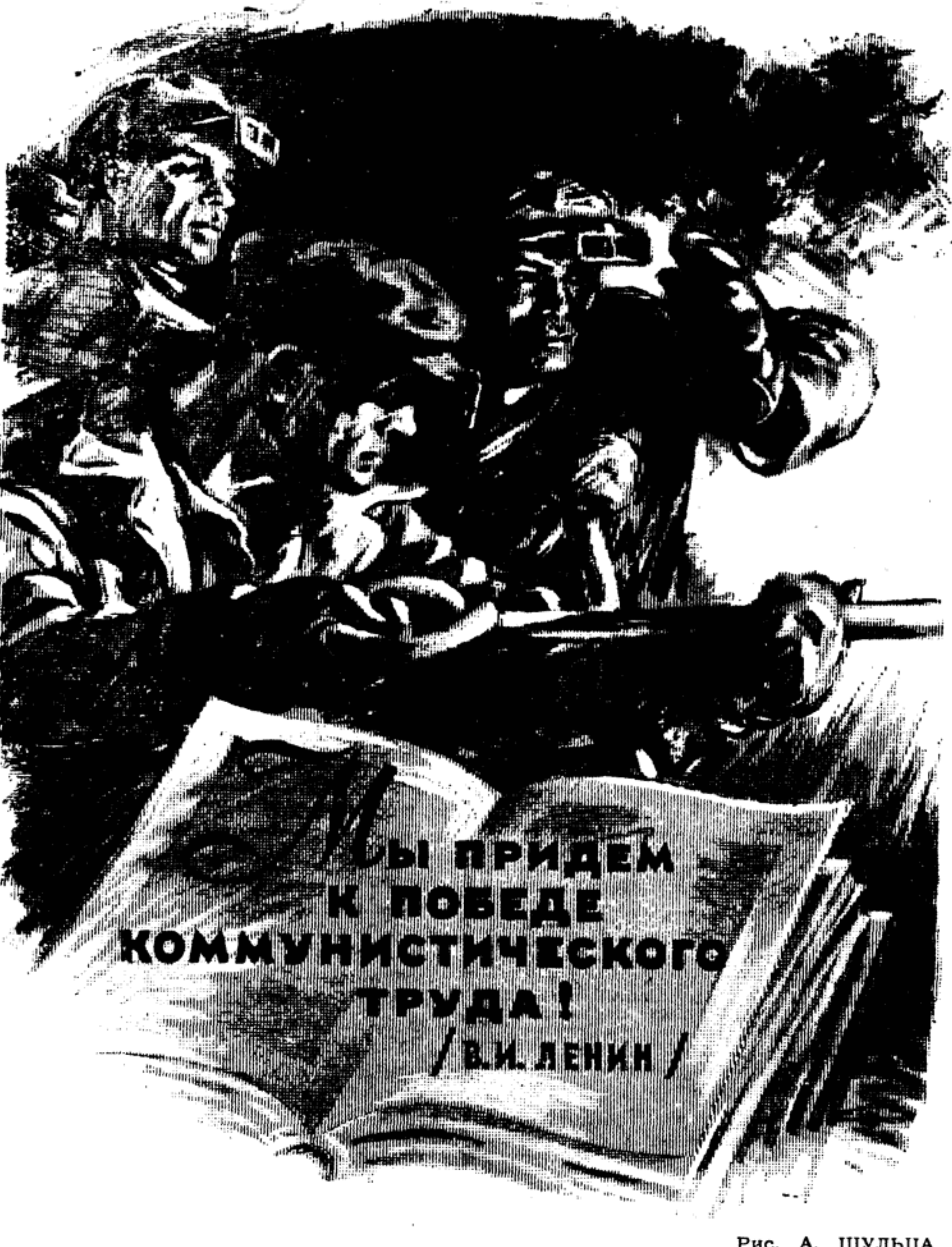
Рис. А. ШУЛЬЦА